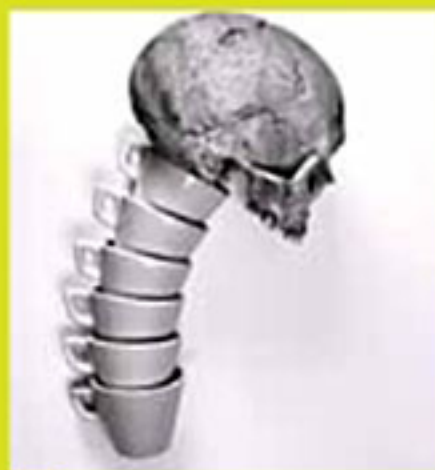
▲ Román Montesinos.